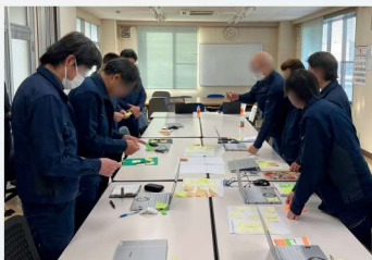
ユニ工業株式会社のカエル会議®の様子

3600社以上の実績をもとに、1社1社の課題に合わせて、 専門コンサルタントが、伴走支援いたします。