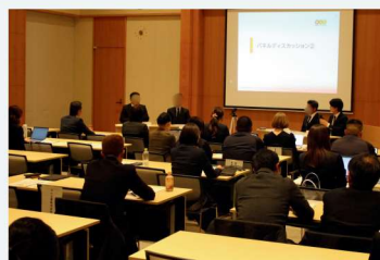
令和7年度の成果報告会の様子