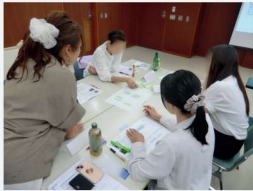
令和7年度の養成講座の様子

自社の働き方改革の推進員として必要な知識を学び、変革を牽引できる スキルを身につけます。(1社2名以上での参加がお勧めです)